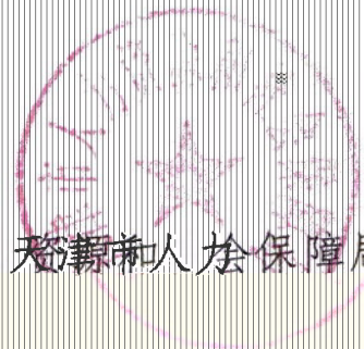
天津市人力资源和社会保障局