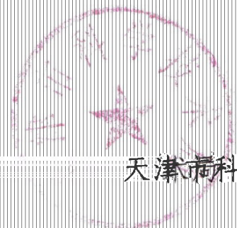
天津市科学技术局