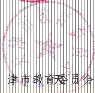
天津市教育委员会